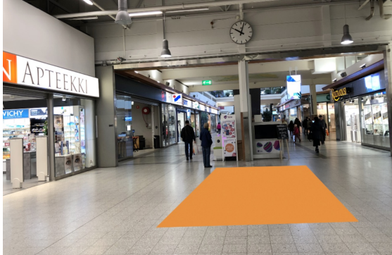
Paikka 1 • Myllyn Apteekki 3 x 4 m