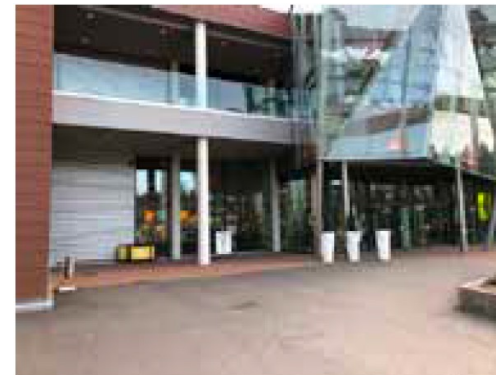
Paikka 5 • Ulkopaikka, sähköt tilattava