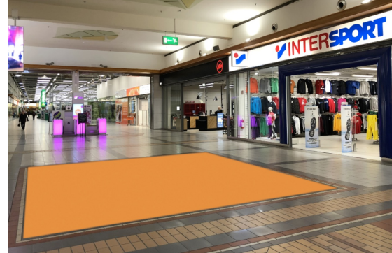
Paikka 2 • Intersport 6 x 5 m (ei sähköjä)