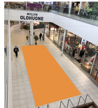
Paikka 4 • Halti 4 x 9 m