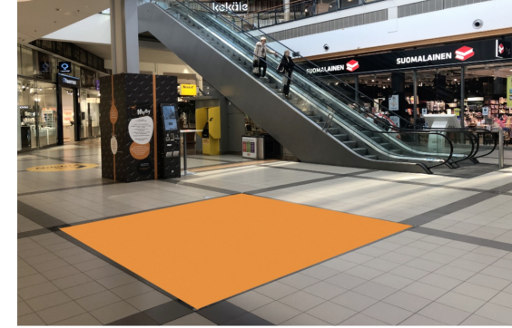
Paikka 3 • Iittala 3,5 x 3,5 m (ei sähköjä)